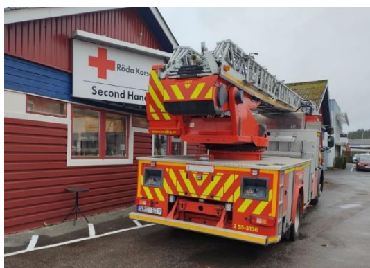
En brandbil kom på besök när styrelsen träffade räddningstjänsten

Vi har haft nio möten och varit mellan sju och nio personer varje gång. Några sticker babykläder, raggsockor och halsdukar som vi skänker bort. Syr kassar och förkläden hemma som levereras till Röda Korset för försäljning. Vi lämnade sex amaryllis till vårt äldreboende i Vallda Blåvinge, till 7 avdelningar. Vi har dessutom pratat, skrattat, druckit kaffe och umgåtts.