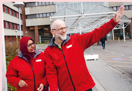
→ Rödakorsvårdar inom sjukvården är en viktig resurs, inte minst vid krishändelser.

patienter fick behandling vid våra behandlingscenter i Sverige.